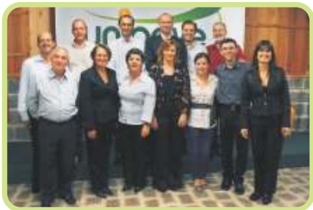
Equipe de Organização

O Programa de Inovação Pedagógica 'Diagnosticar e intervir com o ENADE' é uma iniciativa da Pró-Reitoria de Graduação, de Coordenações de Setores e dos Coordenadores dos Cursos de Graduação que serão submetidos ao ENADE e à avaliação dos próprios cursos no decorrer de 2010 e primeiro semestre de 2011. Elaborado com a contribuição da equipe, o programa é uma inovação na instituição, a qual pretende ser gradativamente ampliada para os demais cursos não contemplados na primeira versão.